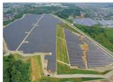
由双日株式会社和双日九州株式会社各出资42%和18%的未来创电上三绪株式会社负责运营的太阳能发电站

可再生能源是不排放温室效应气体的绿色能源，作为地球变暖对策，导入并普及可再生能源是刻不容缓的课题。本公司准确把握目前的社会需求，进步推进太阳能、风力及生物质能等可再生能源领域的业务。