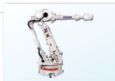
川崎重工株式会社焊接机器人

本公司与双日Machinery株式会社共同从事面向丰田汽车九州株式会社的焊接和涂装机器人（制造商：川崎重工业株式会社）以及压铸机（制造商：宇部兴产机械株式会社）的销售代理店业务。承担在宫田工厂、苅田工厂、小仓工厂的汽车生产的部分业务。