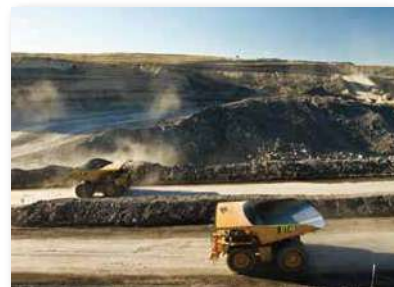
双日株式会社投资额占96%的在澳大利亚MINERVA煤矿的露天矿采掘场

本公司与双日株式会社合作，向九州电力提供核燃料、煤炭、重油等用于发电的能源。缺乏资源的日本在能源方面依赖于海外，本公司为实现长期稳定的供应，可充分有效利用商社所拥有的海外网络之长处从事各项工作。